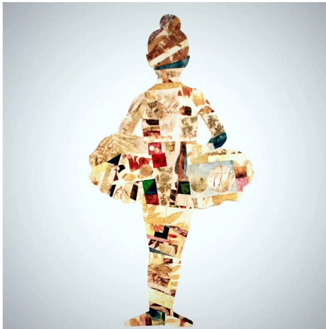
Centoquarantaquattro 120x63 cm tecnica mista su alluminio anno 2024