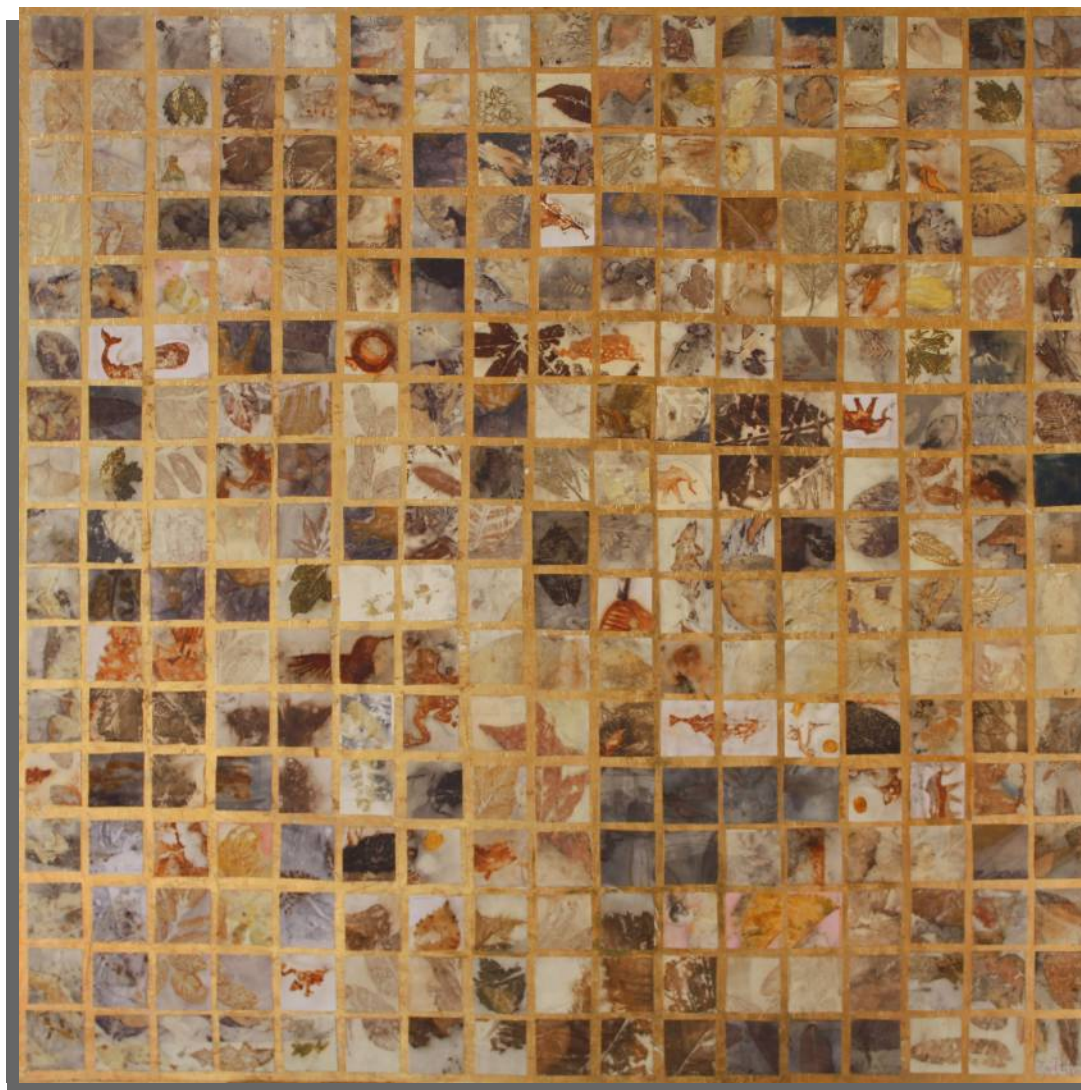
Duecentottantanove 100x100 cm tecnica mista su pvc anno 2021