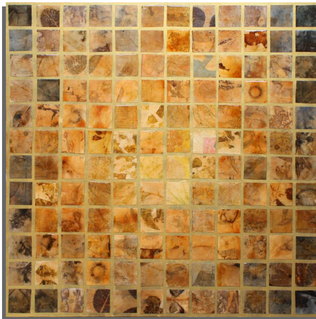
Centoquarantaquattro 70x70 cm tecnica mista su tavola anno 2024