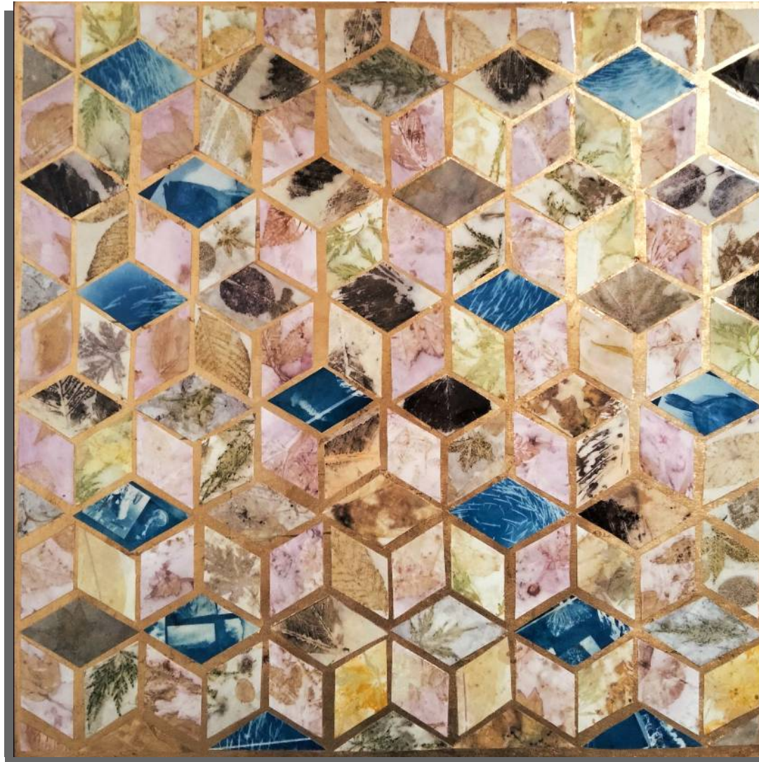
Centotrenta 80x80 cm tecnica mista su tavola anno 2022