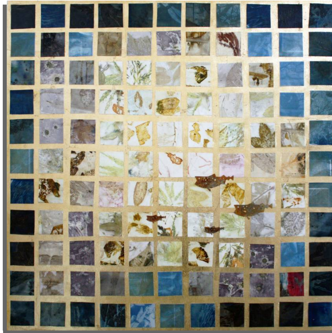
Centoventuno 70x70 cm tecnica mista su tavola anno 2023