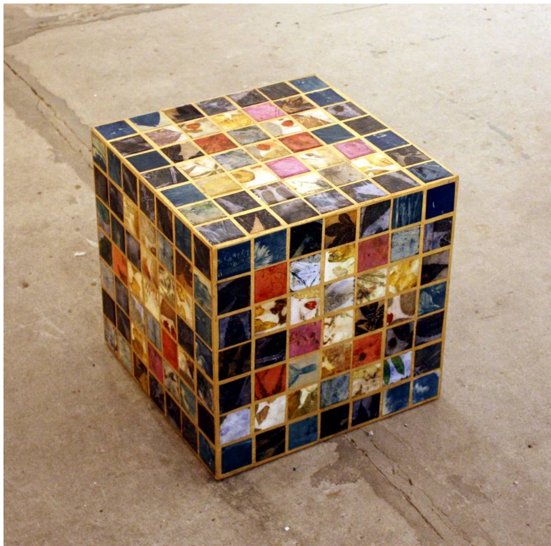
Duecentoquarantacinque 40x40x40 cm tecnica mista su legno anno 2024